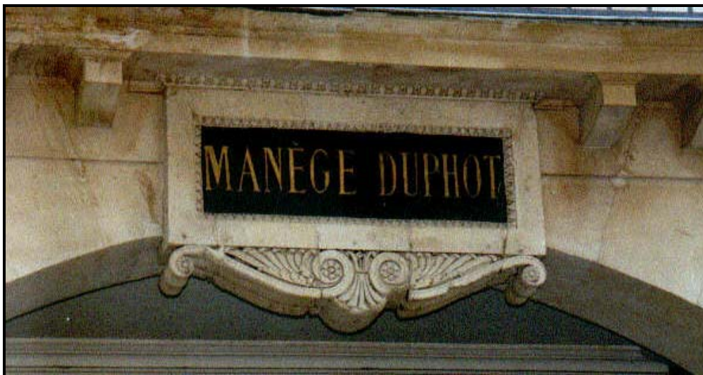
Kuva 3. Manège Duphotia mainostava kyltti kadun puolelta

Vuonna 1847 d'Aure sai viran Saumuren koulusta, josta hän kuitenkin erosi kahdeksan vuotta myöhemmin. D'Aure nimitettiin 1858 Napoleon III (hallitsi 1852-1870) ratsumestariksi ja hiukan myöhemmin (1861) valtion hevossiittoloiden ylitarkastajaksi. D'Aure kuoli Pariisin lähellä 1863.