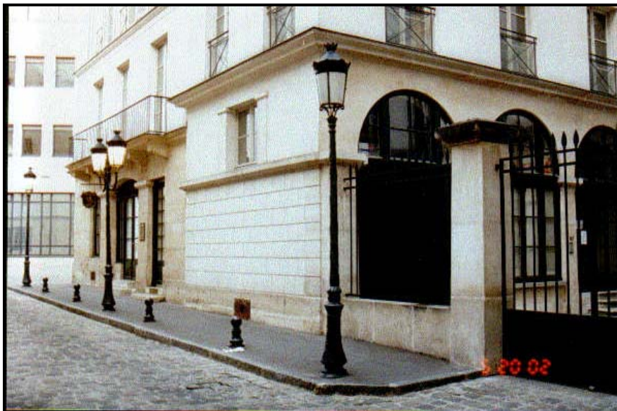
Kuva 3 (alla): Manège Duphot. Kuva sisäpihalta